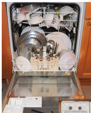
予洗用洗剤を入れる 本洗用洗剤を入れる

ベルギーの家庭に必ずといっていいほど設置されている食器洗い機。手間が省けるだけでなく水の節約にもなり、主婦にとってはうれしい家電製品です。でも使い方を間違えると、機械が傷んだり、食器にくすみがついたりします。毎日使うものなので使い方をしっかり把握しておきましょう。