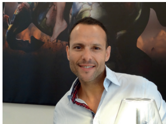
Rue des Minimes 22 1000 Brussels Tel 02 611 45 27 10~19h (木は~21h、日・月・祭休) www.espritbasora.com