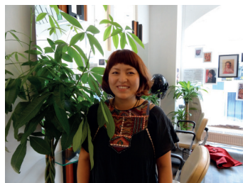
Jean Wellensstraat 7, 1150 Bruxelles Tel 02 520 55 20 11~20h (火~土) 日・月・祭休 www.sui-len-be.jimbo.com