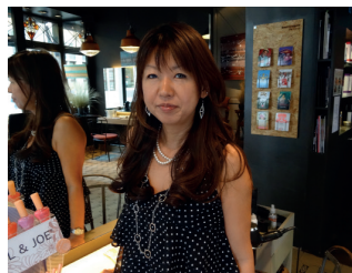
Rue des Chapelier 38-40, 1000 Brussels Tel 02 511 00 01 9h30~18h30 (月) ~19h (火・水・土) ~20h30 (木・金) 日・祭休 www.mariannegrays.com